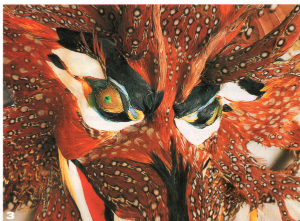
2. Nelly Saunier, diplômée en plumasserie, est parée de ses créations. 3. Structure d'épaule Dragon , mêlant des plumes de tragoan, paon médaillon, oiseau de Paradis, faisan doré, faisan commun et Cygne.

des accessoires de tête. Cascade de plumes teintées, coiffe Soleil, Lune en plume d'autruche et de mandou. « Je puise mon inspiration dans les couleurs, la matière plume, la nature fait tellement bien les choses... » Elle élabore des structures très légères à base de fil, les plumes sont montées sur des filins en laiton, du fil de pêche, de la chenille (fil recouvert de mousse). « Ma façon de com-