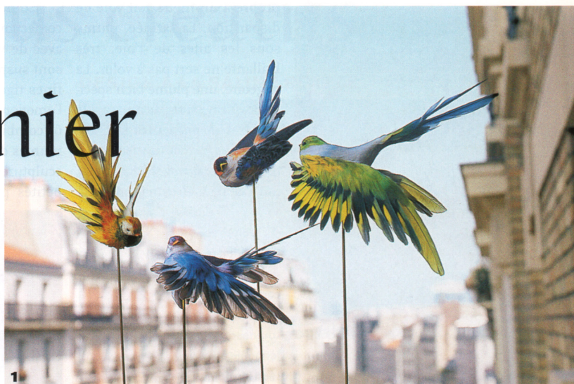
1. Sculptures en plumes, créations originales pour le salon maison et objets en 2003. Sesshū (vert), Steke (jaune), Lorca (bleu) et Stern (turquoise).

Nelly Saunier ne marche pas, elle vole, son regard se porte vers le haut, le ciel... Dans un battement d'ailes, elle nous emmène dans le tourbillon insensé de ses plumes multicolores. « La plume ne m'a jamais quittée, elle a tou-